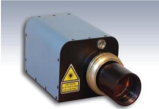
Aluminum Profile Sensor with scanner