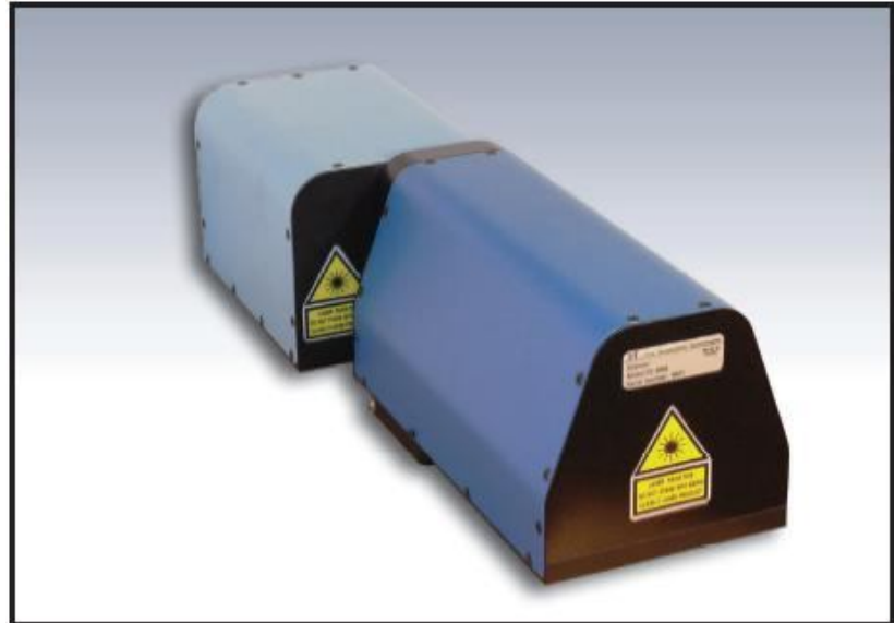
Perfil de Aluminio