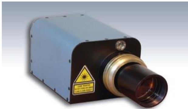
Aluminum Profile Sensor with scanner